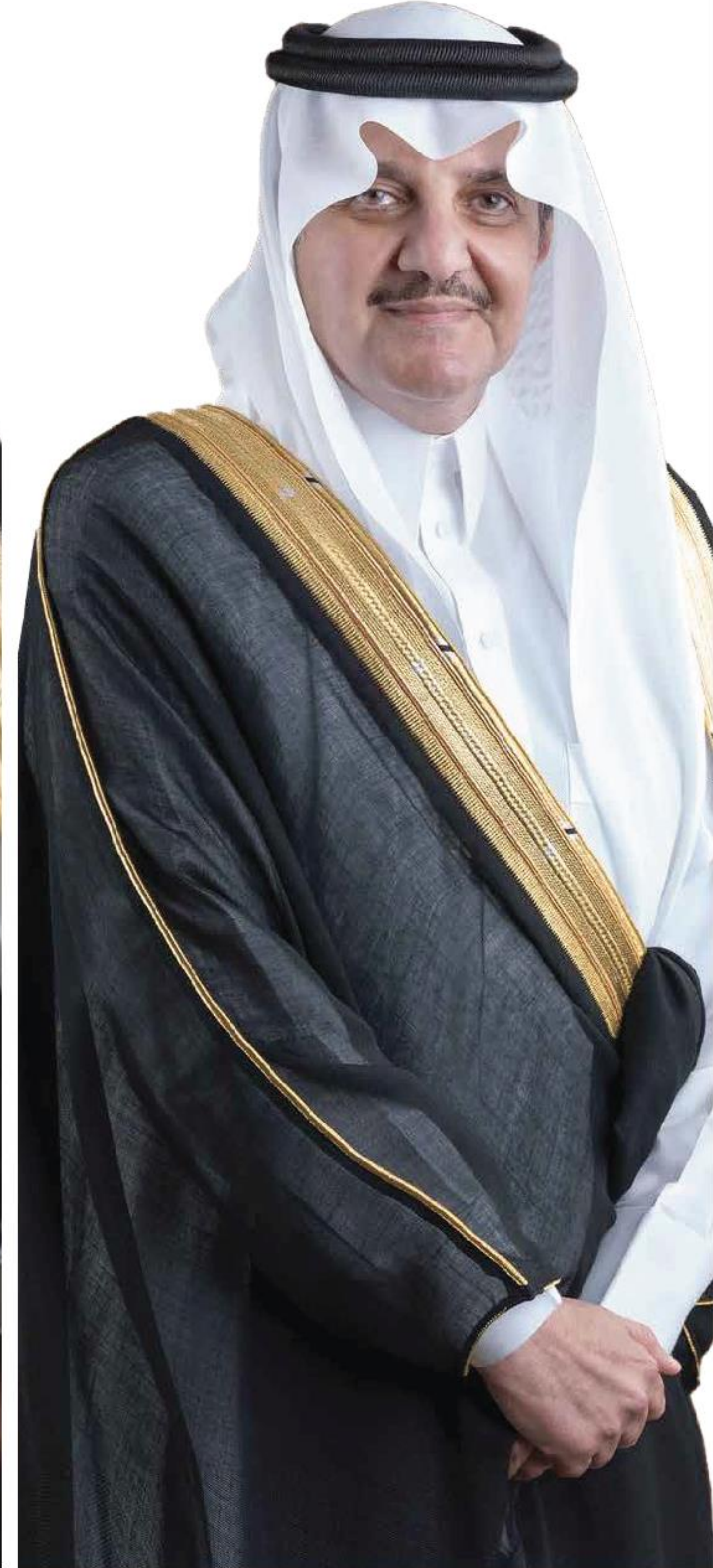
صاحب السمو الملكي الأمير سعود بن نايف بن عبد العزيز آل سعود أمير المنطقة الشرقية