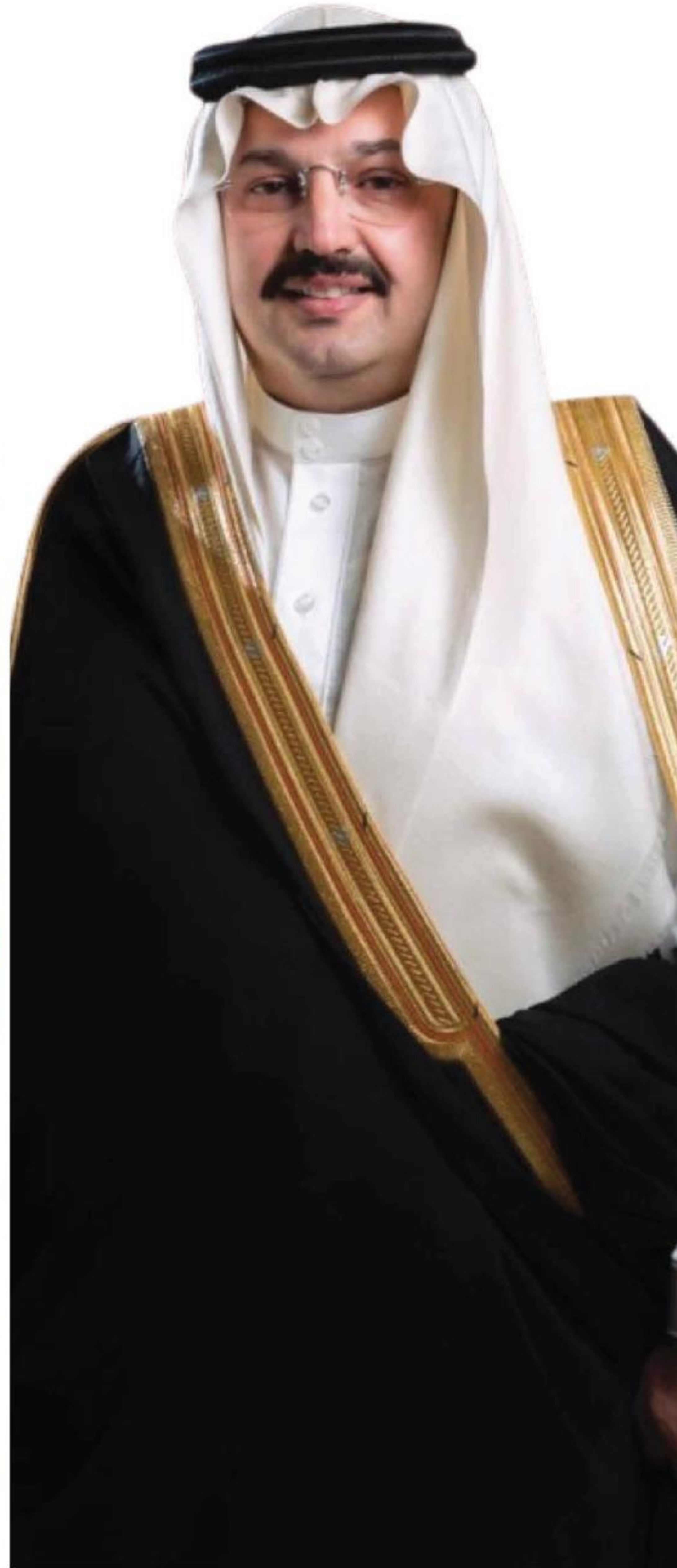
صاحب السمو الملكي الأمير تركي بن طلال بن عبد العزيز آل سعود أمير منطقة عسير