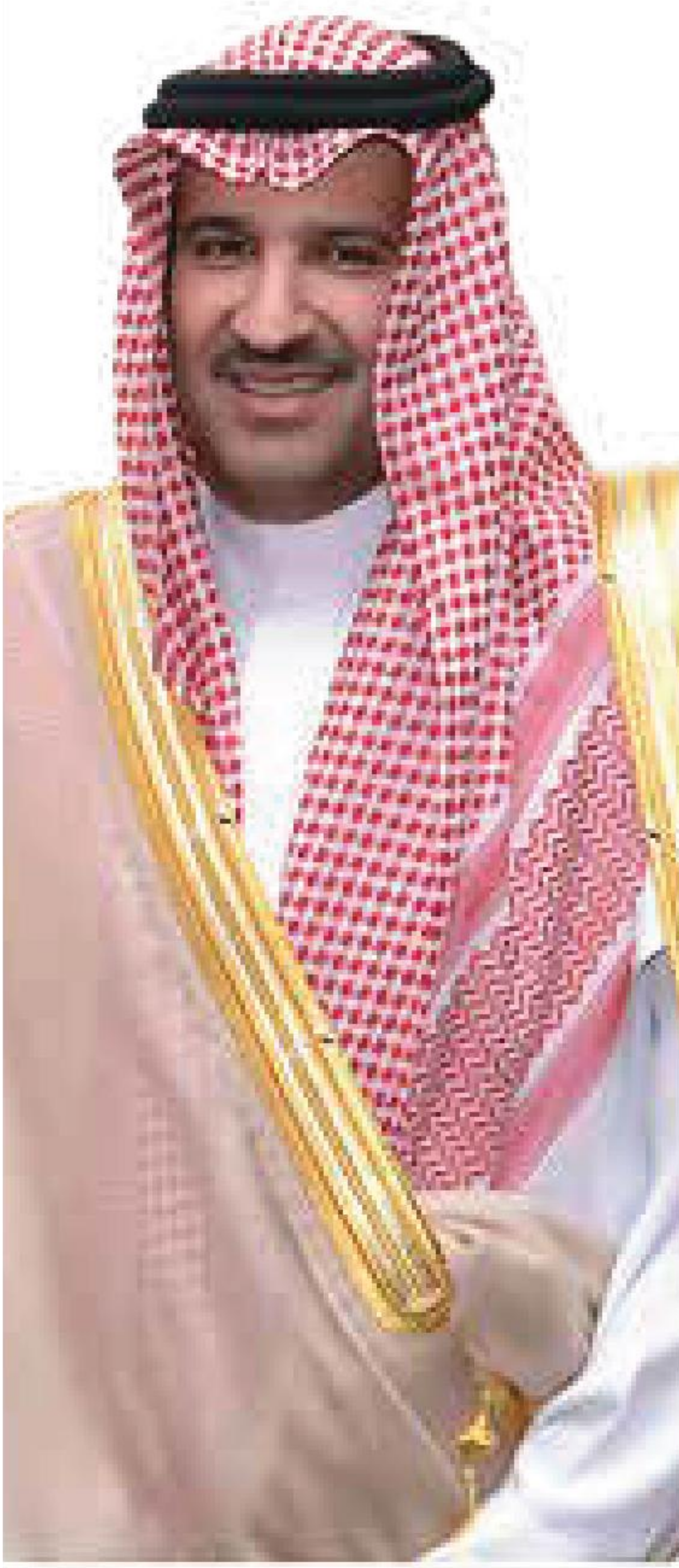
صاحب السمو الملكي الأمير فيصل بن سلمان بن عبدالعزيز آل سعود أمير منطقة المدينة المنورة